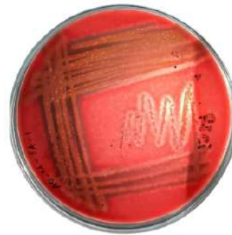
Blood Agar plate CTI (Bakteri Staphylococcus aureus )

Tersedia dalam kemasan 10 disposable plates Blood Agar steril.